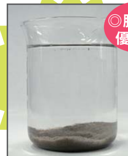
アニオン凝集剤 + FKフロックDR